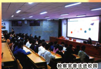
检察官普法进校园