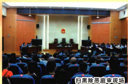
扫黑除恶庭审现场