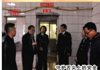
守护舌尖上的安全

坚定政治站位，忠诚履职尽责，坚守初心，砥砺奋进，以“党建红”引领“检察蓝”，不断推进检察工作创新作为。