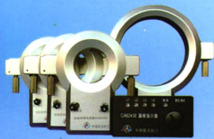
电缆型故障指示器