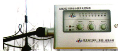
配电自动化终端（钟罩式）