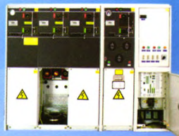
智能一体化环网柜

地址：深圳市福田区深南大道4019号航天大厦B座5楼 邮编：518048 电话：0755-83730111 传真：0755-83731366