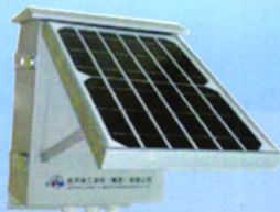
架空型故障指示器