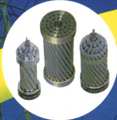
架空导线、地线 (铝包钢绞线、特种导线): Overhead Conductors, Ground Wire (al-clad steel wire/special wire):