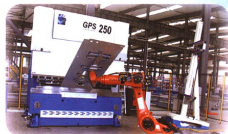
板材智能化加工系统

主要产品为126-252kV组合电器、40.5kV及以下高低压开关柜、12-40.5kV户内及户外断路器、箱式变电站、环网柜及智能配套组件等系列产品。