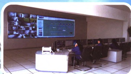
用户变电站电能远控中心