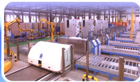
开关柜智能化生产线