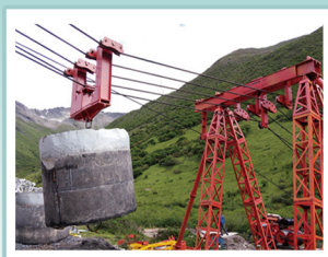
100kN级四索超重型货运索道

输电线路货运索道设计及计算软件由中国电力科学研究院有限公司自主开发,采用多索耦合结构精细化计算方法,实现了多承载索多跨复杂工况下货运索道的准确计算分析,结合标准化部件数据库实现了货运索道自动化选型设计,技术达到国际领先水平。中国电科院使用该软件率先成功研制100kN级超重型四索货运索道并完成工程试验,为重型货运索道的的设计提供了技术支撑。该软件已在青海~河南、张北~雄安、陕北~湖北等多个特高压工程中应用,促进了输电线路货运索道的规范化,进一步提升了货运索道安全管理和技术水平,为输电线路工程中山区物资运输提供安全保障。