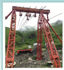
100kN级四索超重型货运索道-支架