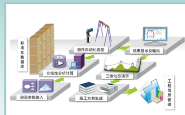
输电线路货运索道设计及计算软件技术流程