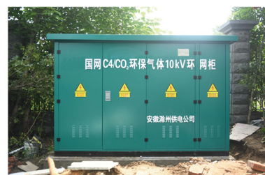
10kV环保气体环网柜示范应用