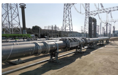
特高压环保管道样机带电考核