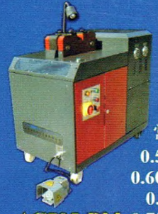
AC705-BM 铝合金扁带专用冷焊机