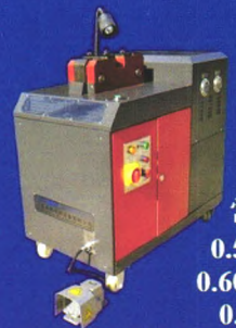
AC705-BM 铝合金扁带专用冷焊机

常用模具 0.50*9.5mm 0.60*12.7mm 0.65*19mm 0.75*25.4mm