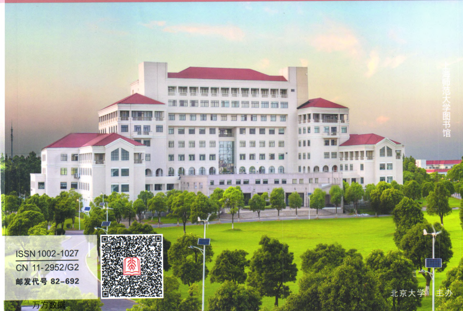
上海师范大学图书馆