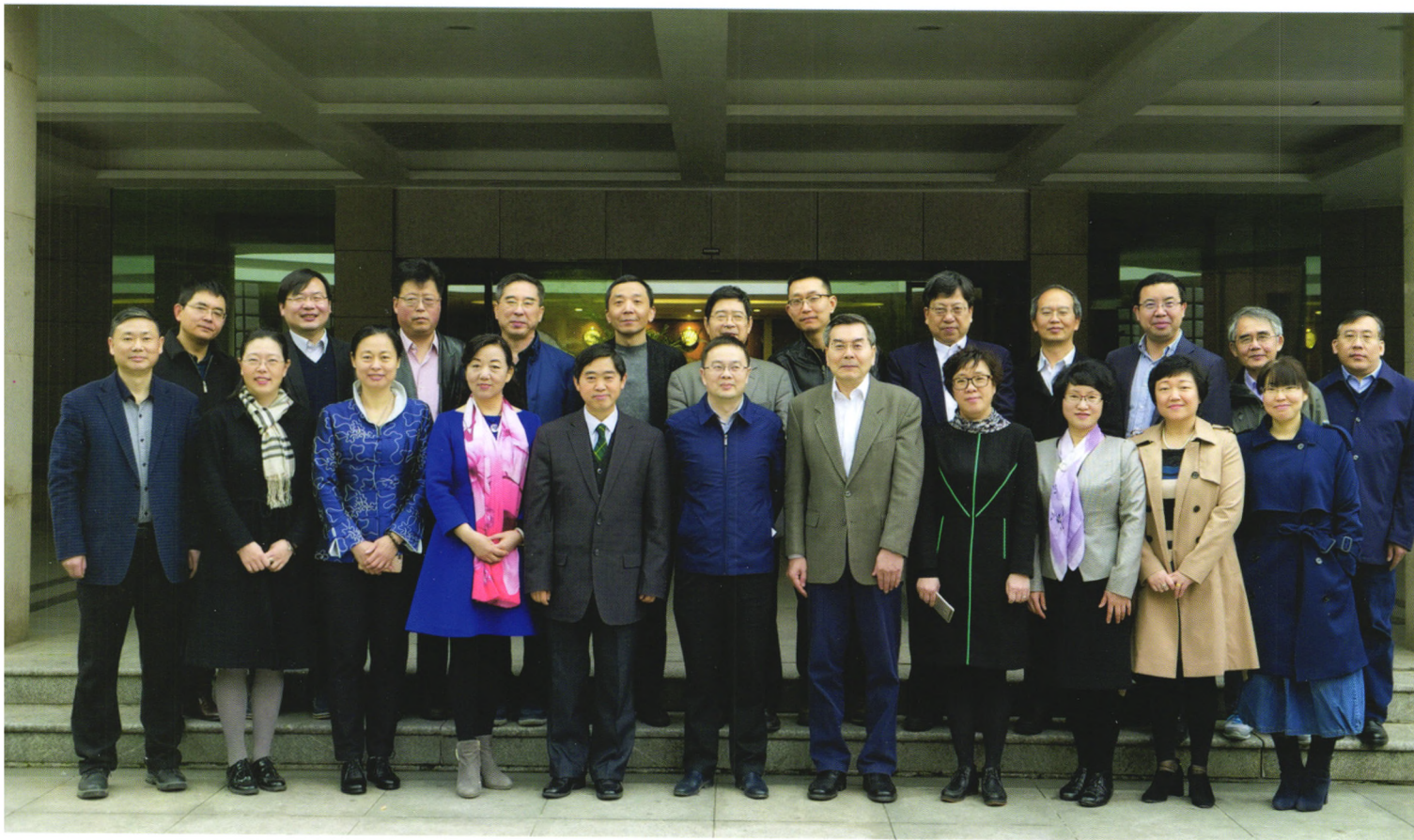
“创新与发展：新时代的图书馆与图书馆学” 高端论坛暨《大学图书馆学报》2018年编委会合影