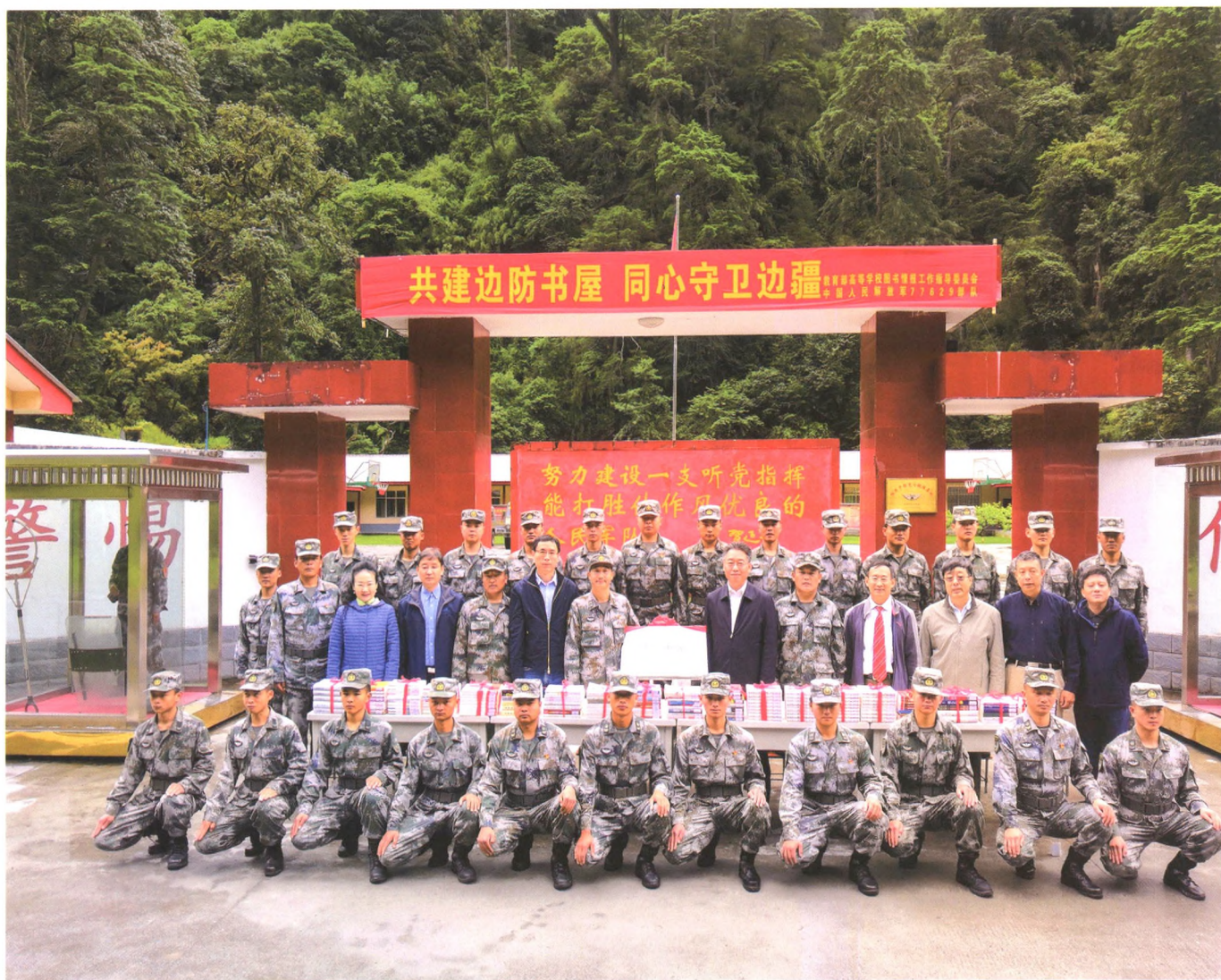
2019年7月23日,教育部高校图工委向驻藏某边防团援建“边防书屋”