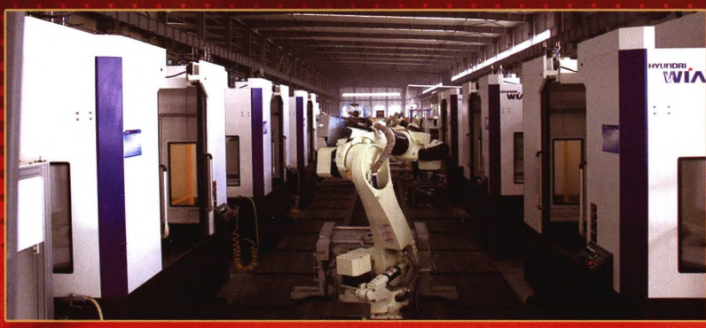
转向节机加自动线

湖北三环锻造有限公司是三环集团有限公司的子公司，是采用模锻工艺生产钢质模锻件专业化厂家，现拥有以国际先进水平8000T、6300T电动螺旋压力机为主体的17条锻造线，以网带式连续电加热调质炉为主体的14条热处理线，以德国、日本、韩国加工中心为主体的26条机加线和19条模具加工线。已具备年产锻件10万吨，主导产品汽车转向节300万件的生产能力，年产销规模达10亿元。拥有Solidworks、NX8.5三维造型，Deform10.0、AFDEX锻造成形有限元分析等产品开发模拟仿真软件；拥有以汽车零部件涡流硬度裂纹检测系统和三坐标测量机为主体的先进质量检测设备；已通过IATF16949、ISO14001、OHSAS18001体系认证；德国联邦铁路产品认证；公司检测手段完备，质量保证体系健全，产品质量稳定可靠。