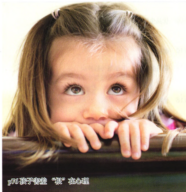
p76 孩子害羞“根”在心理