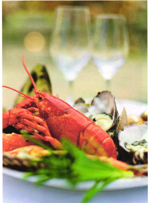
p82 低嘌呤饮食 让痛风远离你