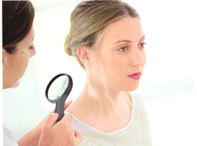
p40 皮肤有病不再只是“逆来顺受”