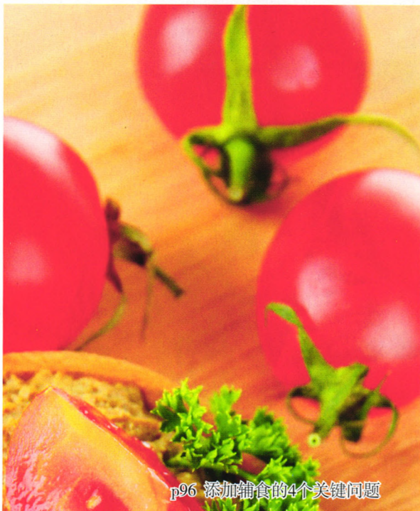
p96 添加辅食的4个关键问题