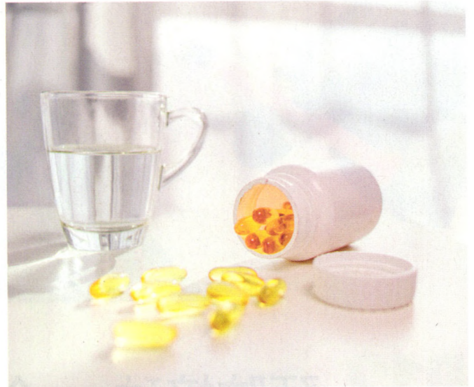
p60 抗生素不能想吃就吃