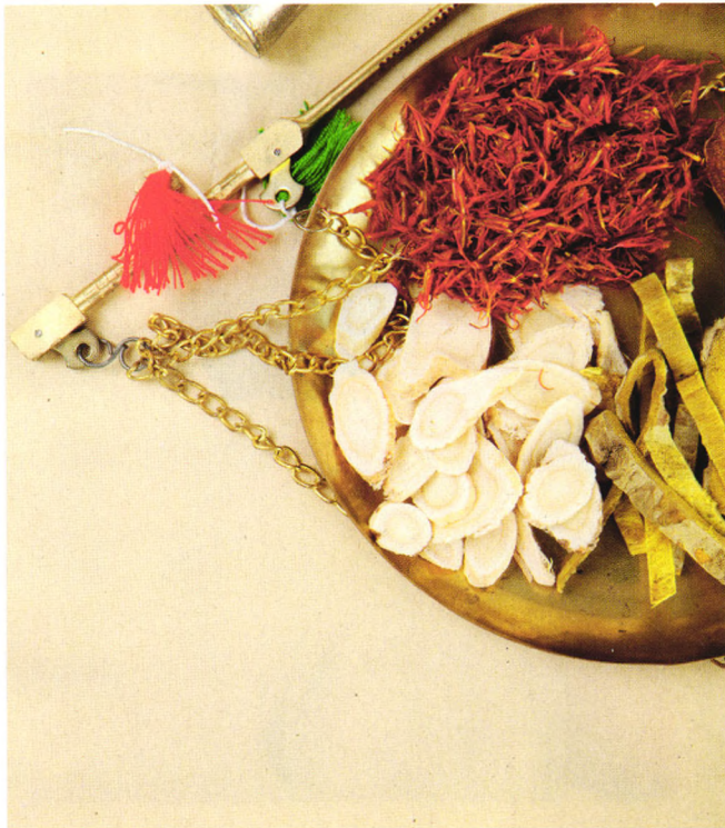
p68 名老中医夫妻的养生之道