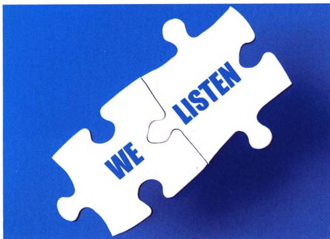
p12 爱耳护耳，听见未来