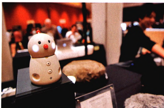
p110 老龄社会陪伴者等