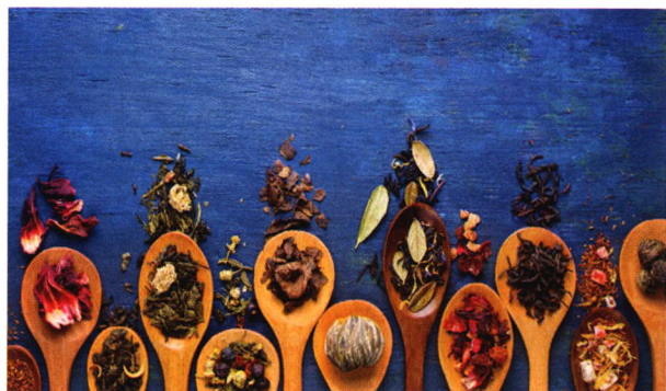
p73 宅家抗疫可用中药香薰法