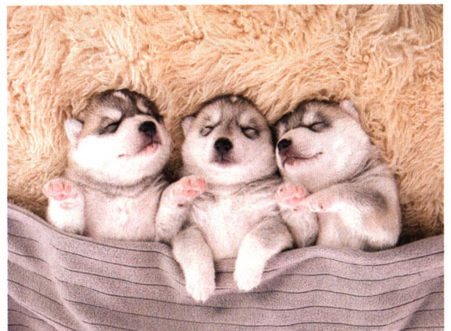
p48 关于睡眠的4个真相