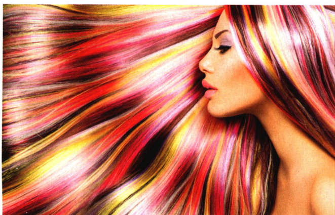
p108 染发剂致癌？六大技巧避雷区