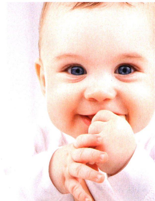
p52 宝贝竟是先天性青光眼？别慌