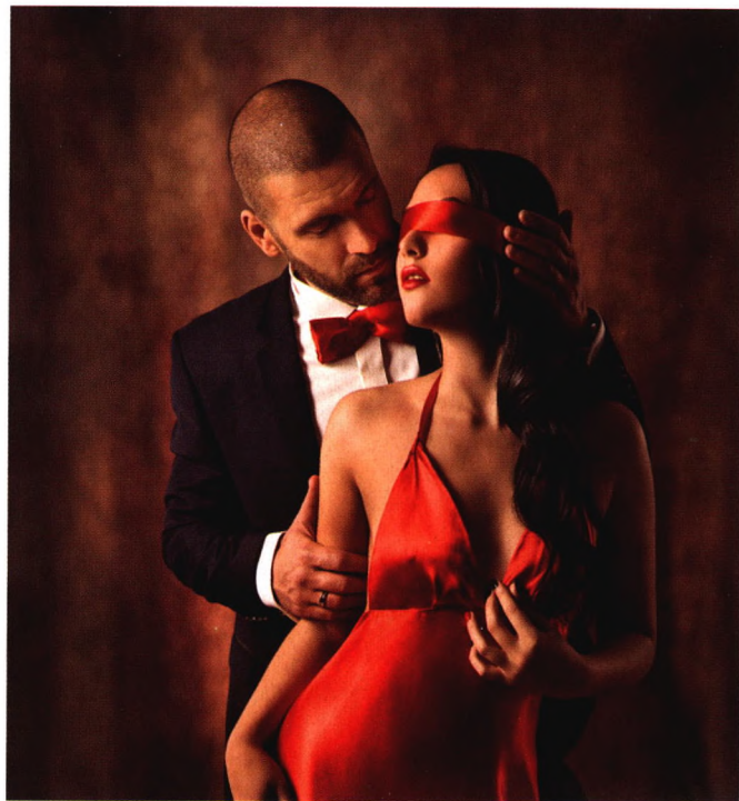
p116 五个“巧”为性生活额外加分