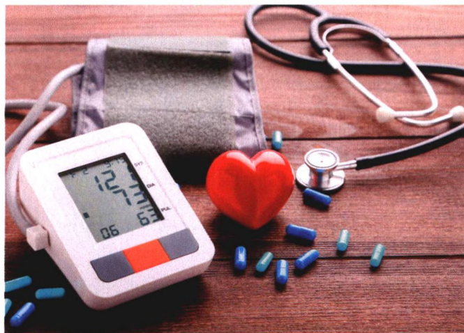
p62 降压药致癌，是谣言还是真相