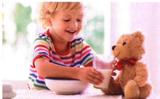
p88 喝豆浆能代替吃豆腐吗