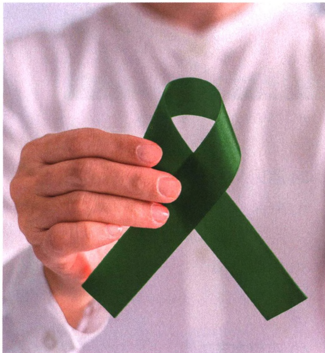
p54 乙肝，一定会发展成肝癌吗