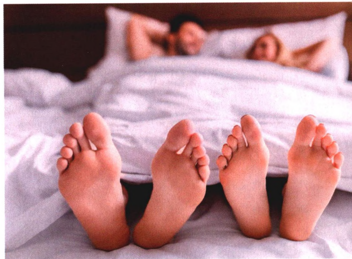
p108 “金枪不倒”真的好吗