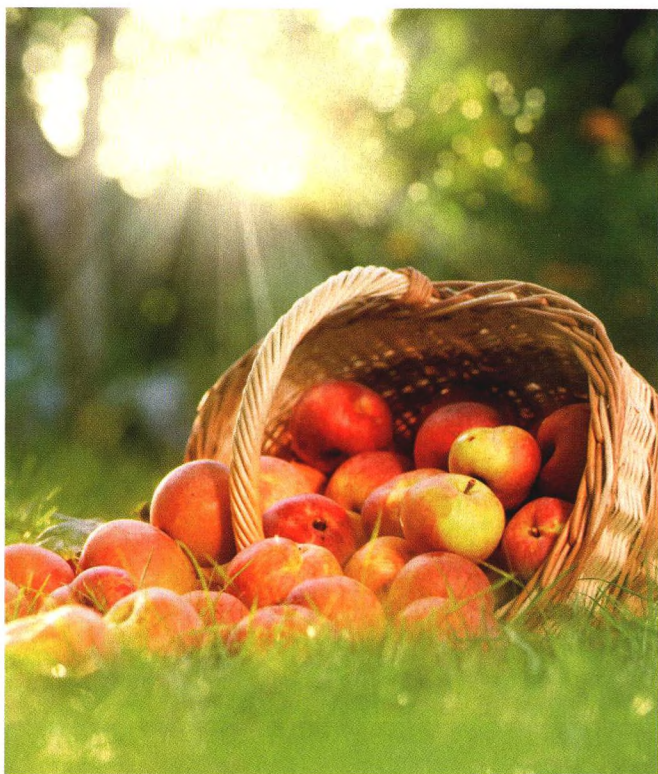
p80 哪些食物能帮你控制血压