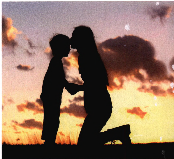
p110 一周确诊罕见病，幸还是不幸