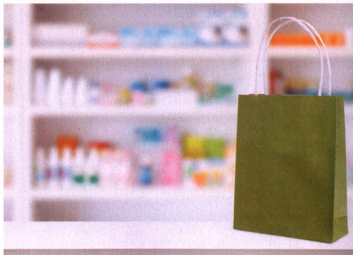
p62 服用OTC药物，牢记四要点