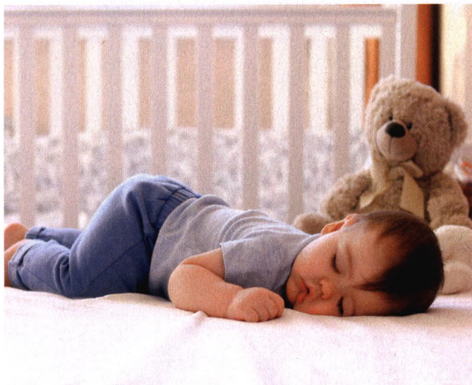
p100 “躺”赢人生，就缺一张硬板床？