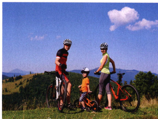
p96 骑车的魅力，谁骑谁知道