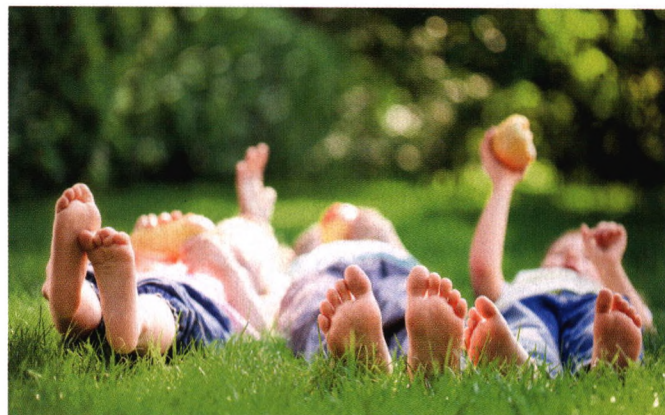
p90 饭后吃水果，真的好吗