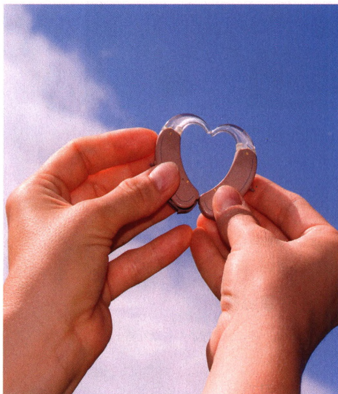
p54 老年人啥时候该配助听器