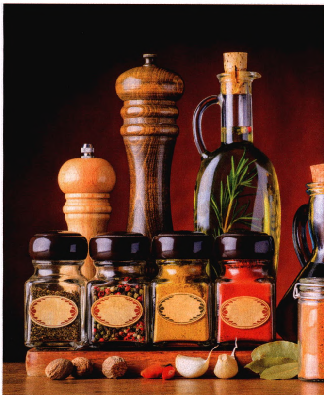
p82 吃盐越少越健康？未必