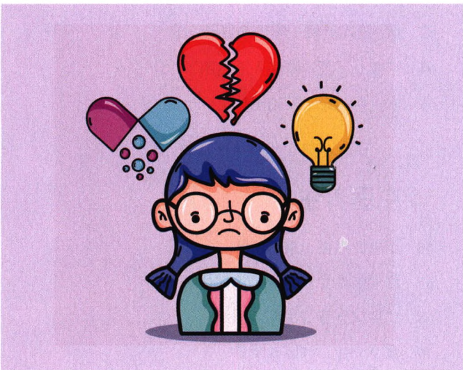
p18 陪你一起聊聊衰老的大脑