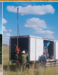
TGQ-75型 车载全液压取样钻机