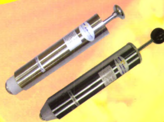
万能弹簧冲击锤试验装置