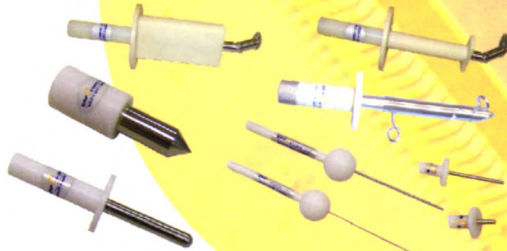
防触电及防固体进入测试系列