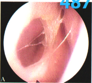
图1 A 术前, 鼻中隔前下部可见一直径约1.7 cm的穿孔