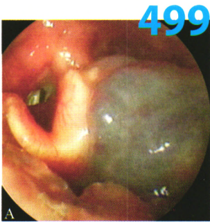
图1 A 血管瘤治疗前