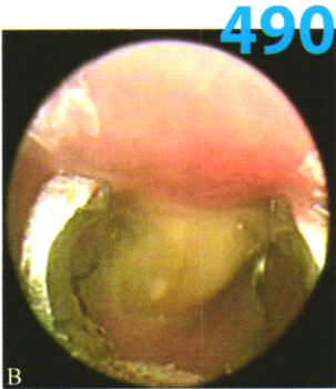
图1 支撑喉镜下, B 钳夹异物