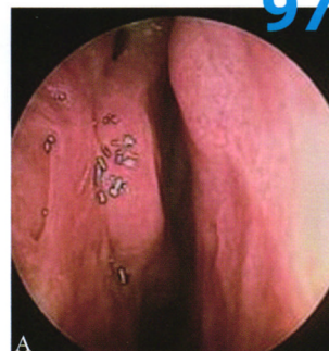
图1 A 右侧中鼻甲与外侧壁广泛粘连