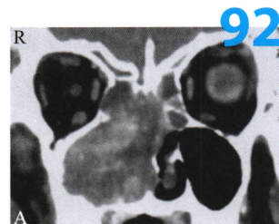
图1 A 术前鼻窦CT冠状位, 后外壁骨质内缘呈虫蚀样改变, 骨壁连续无中断, 窦壁增厚硬化