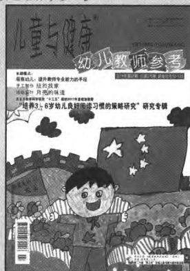
封面题图 / 沈奕辰 封面设计 / 伍韵 景晨