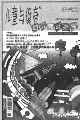
封面题图 / 郭明洋 封面设计 / 伍韵 景晨