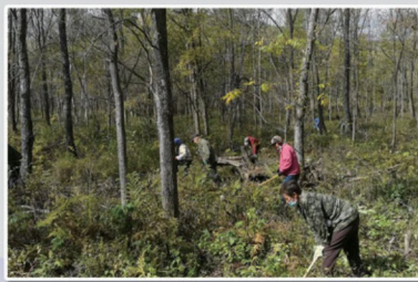
优树良种苗木生长情况