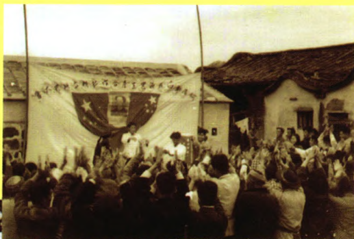
厦门何厝生产合作社成立大会

新中国成立初期,我们党在全国范围内组织完成的对于农业、手工业和资本主义工商业的社会主义改造,标志着我国基本上实现了把生产资料私有制转变为社会主义公有制,我国初步建立了社会主义的基本制度。从此,进入社会主义初级阶段。社会主义改造得到了人民群众的普遍拥护,大大促进了工农业和整个国民经济的发展。