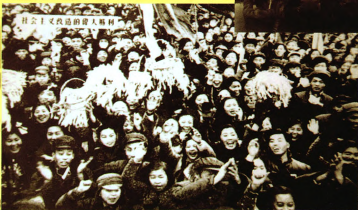
北京各界庆祝社会主义改造胜利