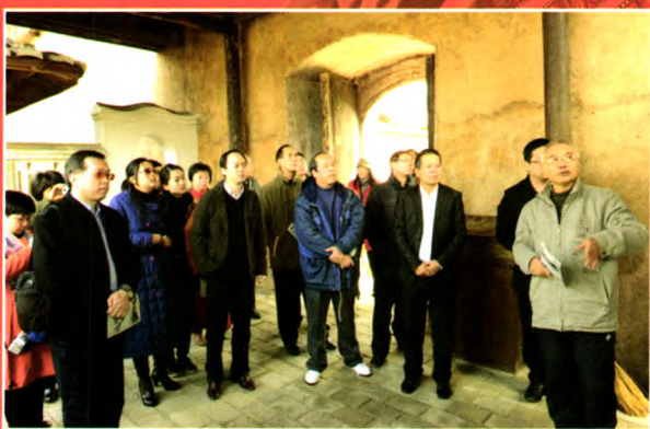
与会代表参观国民党中央直属台湾省党部旧址复兴堡

此次抗战史研讨会的成功召开,立足于贯彻中央党史研究室关于深化党史研究的精神要求,致力于推进福建抗战史的系统研究和深化研究,着力于提高我省新民主主义革命时期党史研究水平,也是迎接纪念抗日战争胜利70周年的一个前期准备;研讨会活跃了学术气氛,促进了学科建设和党史队伍建设,尤其是