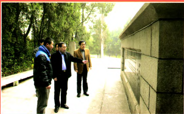
与会代表瞻仰革命烈士墓

促进了开门办史,密切了党史部门与有关部门的沟通和联系,充分发挥了党史研究各方面军的作用。