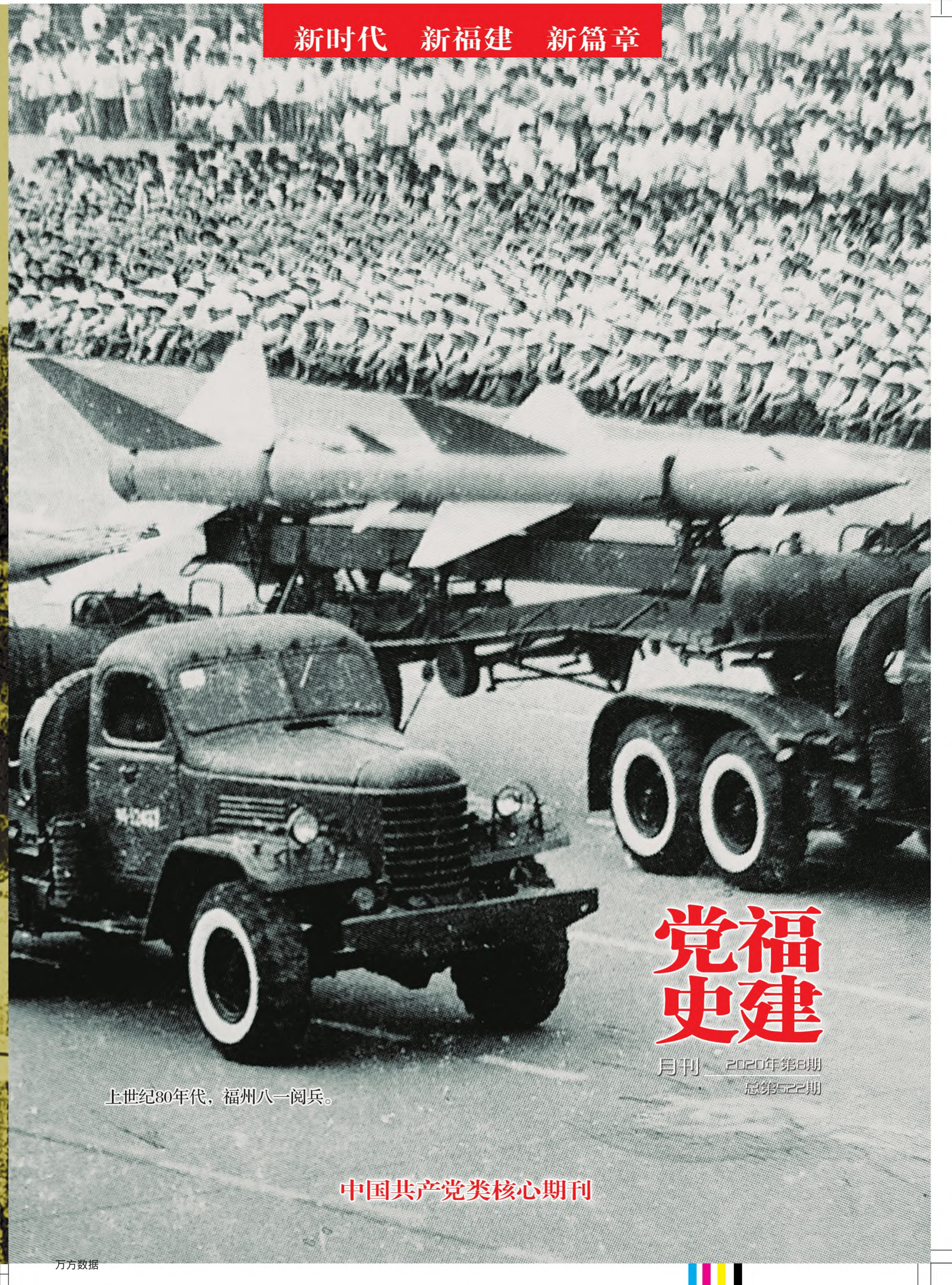
上世纪80年代，福州八一阅兵。