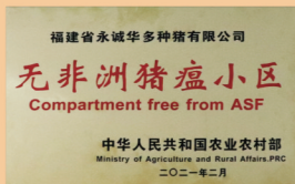
全国首批无非洲猪瘟小区