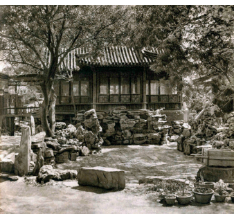
封面设计：北京多义景观规划设计事务所 Cover Design: Atelier DYJG

研究 61 基于国土空间规划调整的日本绿地系统规划演进特征分析 苏畅 章俊华* 66 芝加哥湖滨公园系统发展演变历程 范思敏 刘志成 许晓明* 72 新自然主义种植理念下的草本植物群落空间研究 朱玲 刘一达 王睿 叶峰辛 77 城市历史公园三维可视化评价体系构建与应用 金雅萍 戴开宇 戴代新* 83 城市绿地景观格局对“核心生境”质量的影响探究 韩依纹 李英男 李方正* 88 城市住区绿地感知与居民压力水平的关系研究——以哈尔滨市 12 个住区为例 董禹 李珍 董慰* 94 生态导向的城市设计——以云居寺文化景区为例 徐全胜 朱颖 100 基于景观偏好理论的城市垂直绿化设计方法研究 沈姗姗 黄胜孟 史琰 包志毅* 106 基于景观偏好的落叶景观营造 樊榕 魏双雨 吉文丽* 110 胶东半岛山岳道家文化景观的序列性“风景道”研究 尹航 张超 赵鸣 116 春秋至两宋时期虎丘理景演变分析 王睿隆