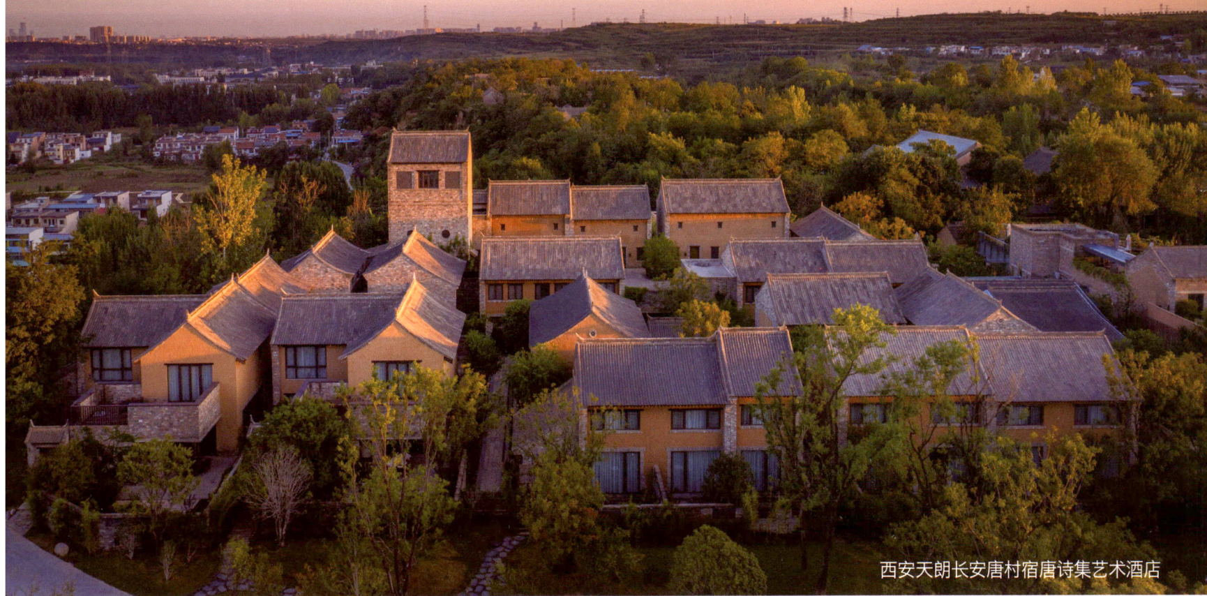
西安天朗长安唐村宿唐诗集艺术酒店