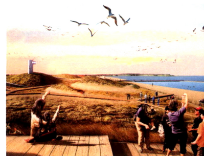
封面作品：特尔多尔国家公园 Cover Project: Tel Dor National Park