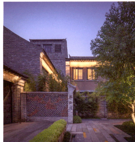
生态环境 Ecology & Environment 城市更新 Urban Renewal