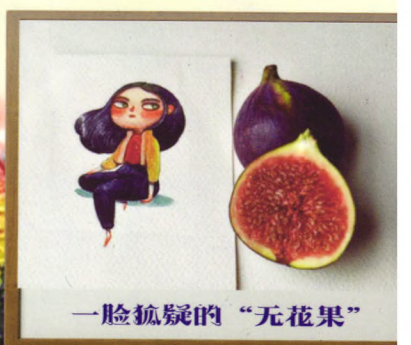
一脸狐疑的“无花果”