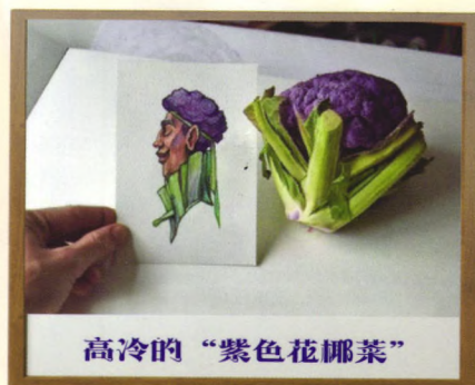
高冷的“紫色花椰菜”