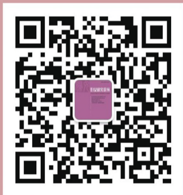
《妇女研究论丛》微信公众号