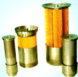
核级水过滤器滤芯