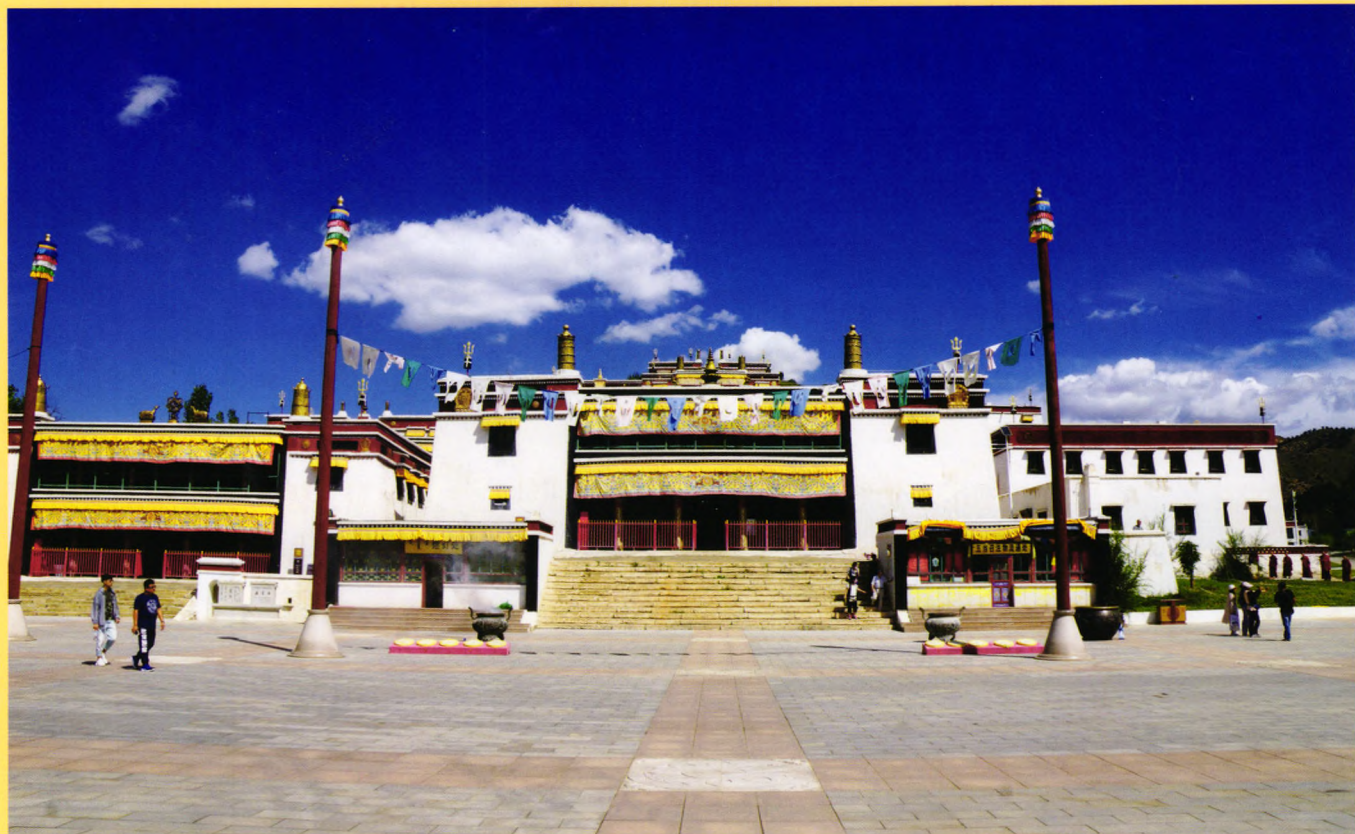
封面：鄂尔多斯乌兰活佛府内蒙古佛教文化博物馆 封底：包头市五当召