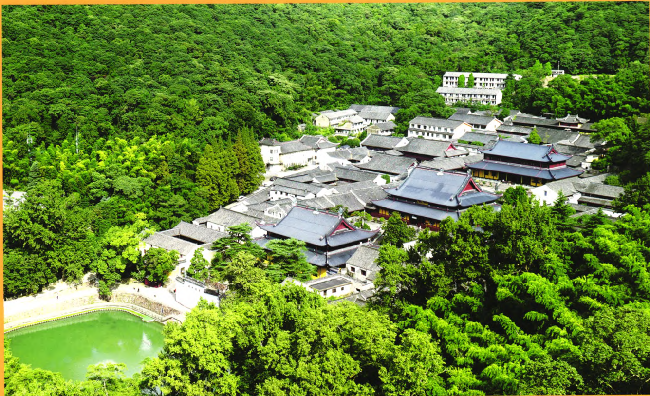
封面：安徽九华山拜经台 封底：深山藏古寺——宁波天童禅寺