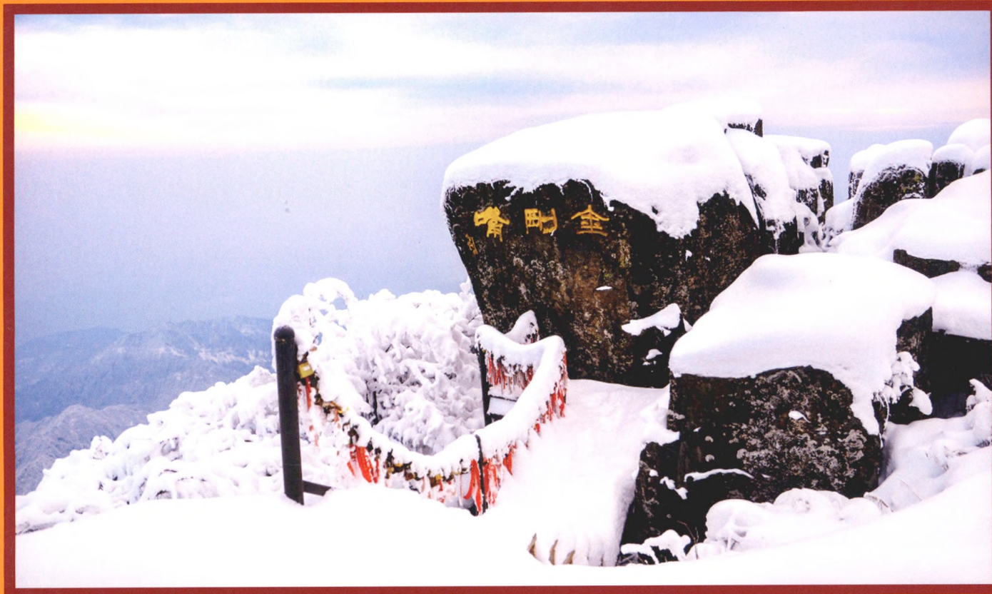
封面：心海·山西五台山 封底：峨眉山金剛嘴