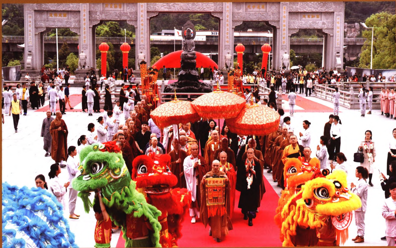
封面：九华山狮子峰秀色