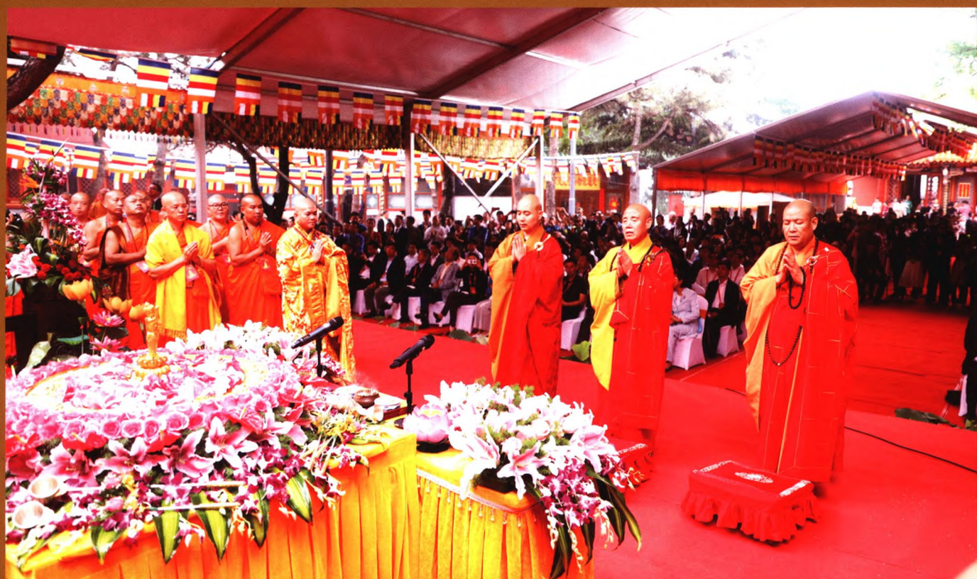
封面：九华山花台栈道