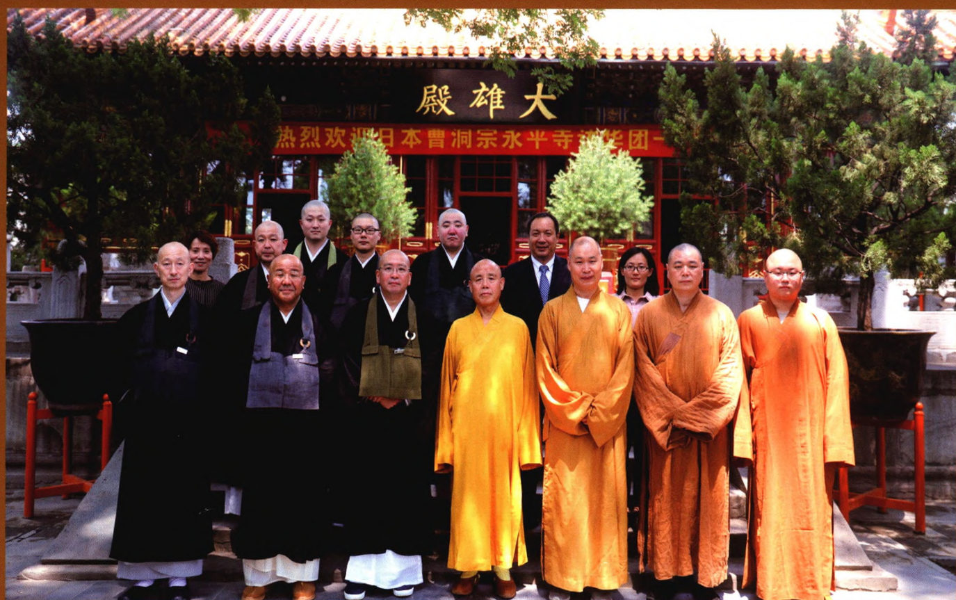
封面：花台秀色 封底：演觉副会长会见日本曹洞宗永平寺代表团