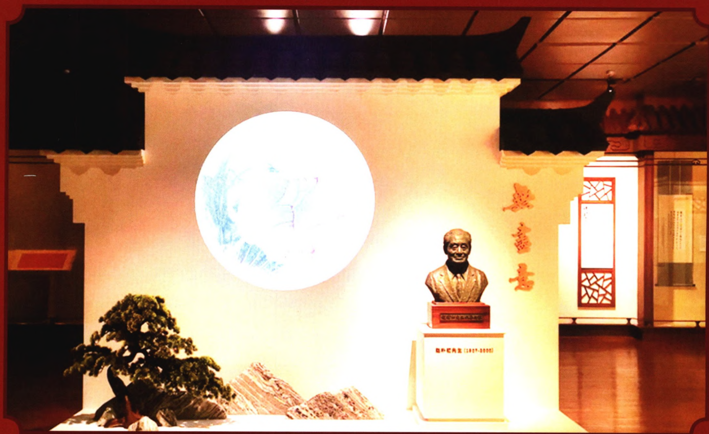
封面：人类文化遗产——大同云冈石窟 封底：“无尽意——赵朴初书法艺术展”