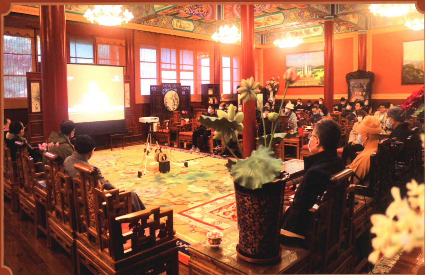
封面：10月26日，十一世班禅在扎什伦布寺多加大院参加“嘎钦”学位立宗答辩，并获得学位 封底：中国佛教协会组织观看中共中央解读十九届六中全会精神发布会