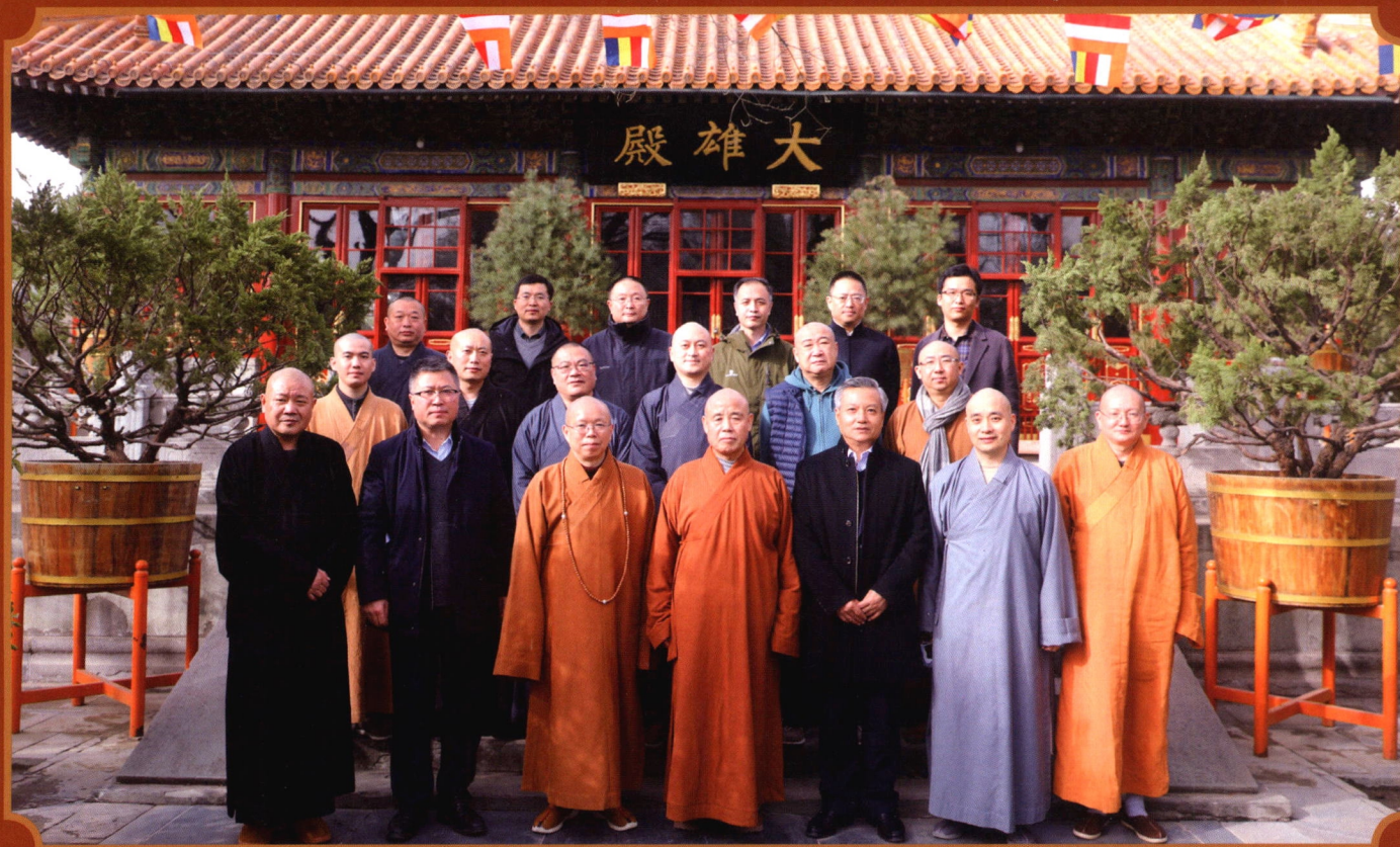
封面：青海省循化县世界吉祥万佛塔