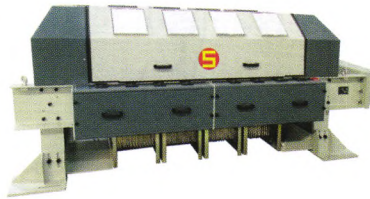
69 宋和宋：产品适用范围更广