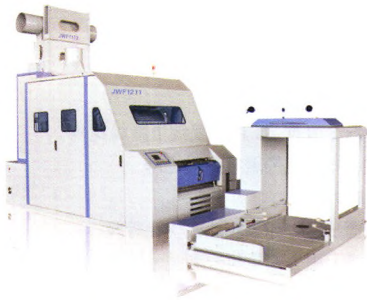
62 恒天集团：集团参展凸显产业配套优势

封面 欧瑞康集团 封二 德国好使公司 拉页 青岛国傲机械有限公司 扉页 慈溪太阳洲纺织科技有限公司 P4 瑞士立达集团 P5 东飞马佐里纺机有限公司 P6 常州宏大科技(集团) P7 重庆金猫纺织器材有限公司 P8 中国国际经济贸易仲裁委员会 P10 经纬纺织机械股份有限公司榆次分公司 P11 立信染整机械(深圳)有限公司 P21 西安滨田特型机械有限公司 P25 《纺织机械》编辑部 P27 太平洋机电(集团)有限公司 P29 江阴艾泰克机械制造有限公司 P31 天津宝盈电脑机械有限公司 P33 上海凯利纺织五金有限公司 P34 浙江扬誉机械制造有限公司 P37 上海和鹰机电科技股份有限公司 P47 济南天齐特种平带有限公司 P56 经纬纺织机械股份有限公司 P58 常德纺织机械有限公司 P59 经纬津田驹纺织机械(咸阳)有限公司 P60 沈阳宏大纺织机械有限责任公司 P61 经纬纺织机械股份有限公司清梳机械事业部 P63 广州丰程机械设备有限公司 P67 中国人民解放军第四八零六工厂 P71 浙江精工科技股份有限公司 P75 深圳市英威腾电气股份有限公司 P85 必佳乐(苏州工业园区)纺织机械有限公司 P93 山西鸿基科技股份有限公司 P95 东台市珠峰纺机专件有限公司 P97 江苏海大印染机械有限公司 P99 青岛同春机电科技有限公司 P101 青岛海佳机械有限公司 P103 常熟纺织机械厂有限公司 P105 中达电通股份有限公司 P107 光洋电子(无锡)有限公司 封三 泰安康平纳机械有限公司 封底 卓郎纺织机械有限公司