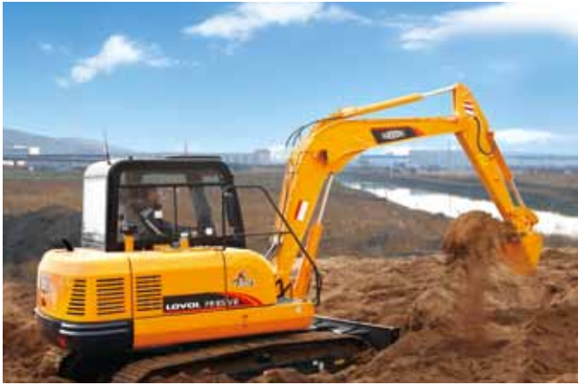
114 值得信赖的好伙伴 雷沃挖掘机用户说