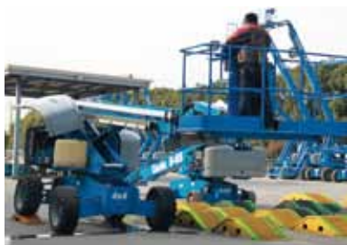
吉尼 匠心独运中国路