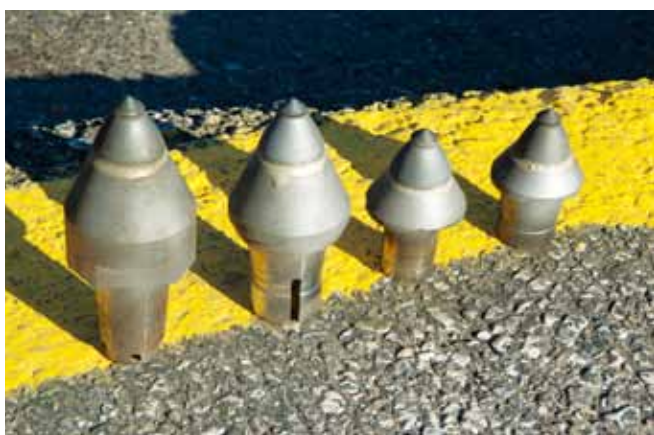
131 非普通刀头 NovaPick钻石刀头确保完成时间紧迫的机场项目