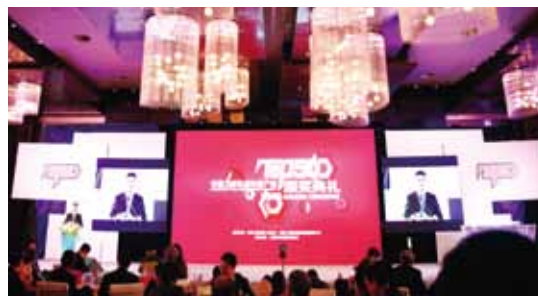
谋略新常态 工程机械产品多维度全升级 “中国工程机械年度产品TOP50（2015）”