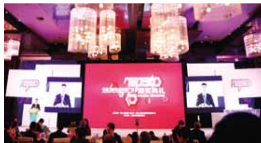
谋略新常态 工程机械产品多维度全升级 “中国工程机械年度产品TOP50（2015）”