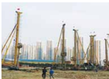
123 桩基础施工新技术专题讲座 (三十五) 内夯式沉管灌注 桩和非取土复合 扩底桩（上）