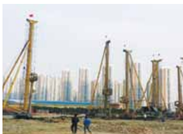
123 桩基础施工新技术专题讲座 (三十五) 内夯式沉管灌注 桩和非取土复合 扩底桩（上）