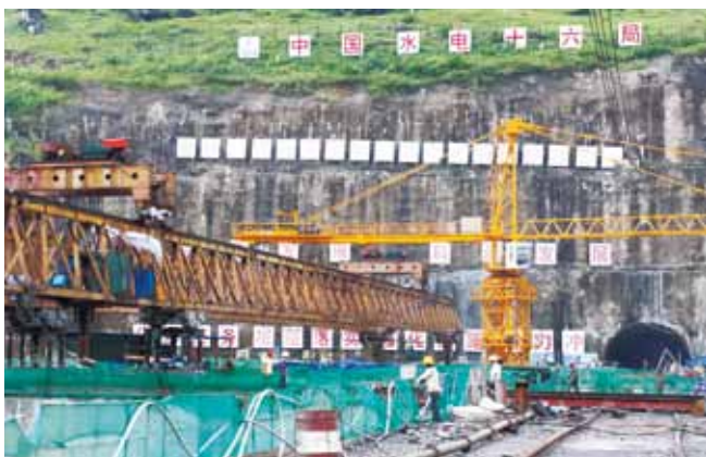
78 公路架桥机在水电站 弧门吊装中的应用