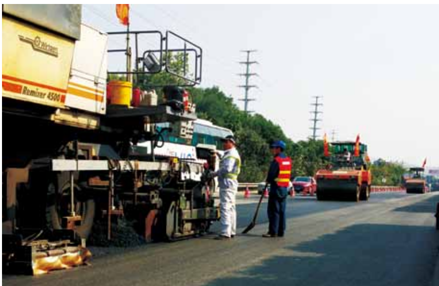
74 就地热再生技术在机荷高速 路维修中的应用