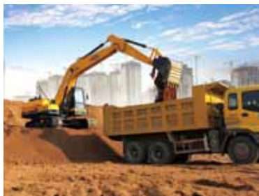
87 好产品赢好口碑 雷沃挖掘机让我走上致富路