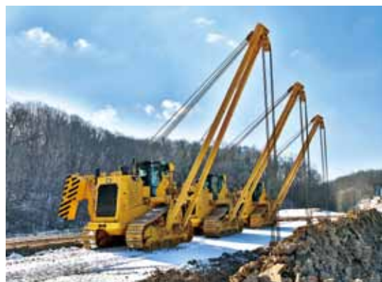
卡特彼勒PL83型吊管机 24