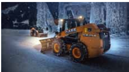
踏足“白银殿堂” 16 凯斯滑移装载机工厂获WCM白银级评定