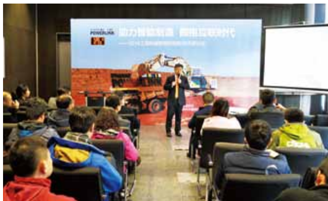
18 控制新技术助推智能制造 2016工程机械智能制造新技术研讨会召开