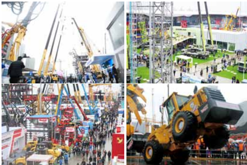
20 bauma China 2016 不忘初心 筑就传奇