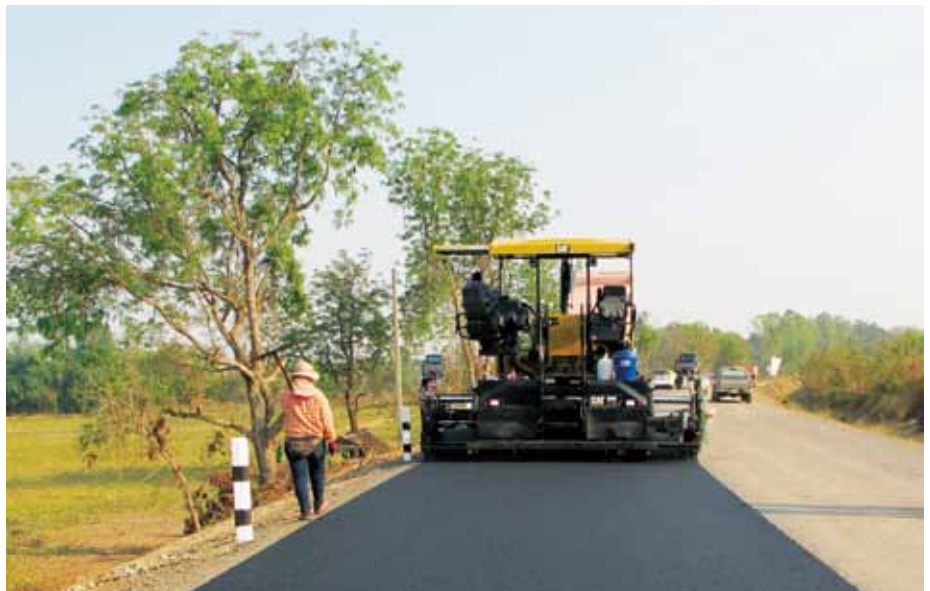
84 Cat® AP655F 更快的摊铺速度