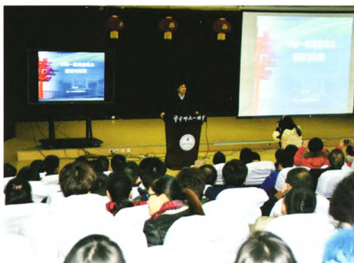
与会代表在华中师大一附中参观考察