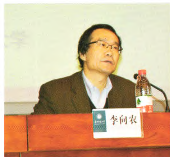
华中师范大学副校长李向农

【本刊讯】2015年12月10日—11日，“信息化背景下基础教育课程改革与发展创新论坛”（以下简称“论坛”）在华中师范大学科学会堂顺利召开。论坛由信息化与基础教育均衡发展协同创新中心、华中师范大学考试研究院和湖北省教育学会联合主办，华中师范大学教师教育论坛杂志社承办。