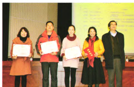
论坛征文大赛颁奖