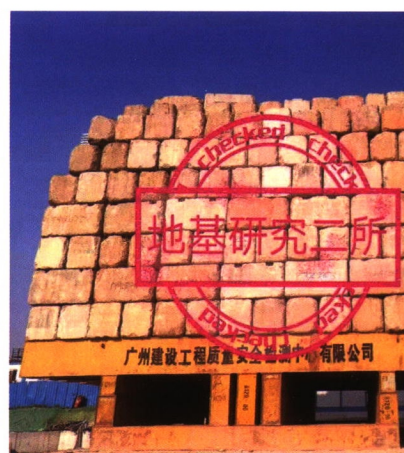
▲ 广州市建科院检测现场