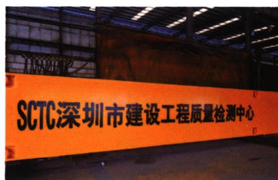
▲ 深圳站 1100 吨钢梁