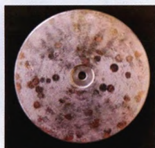
增加粗糙度的触头老练试验前后