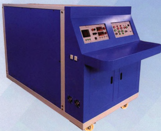
12 kV移动式老练试验装置实物

试品关合时开展高压大电流老练，关合涌流0~4.5 kA可调，频率3 300 Hz，老练预击穿电弧能量约为型式试验下的30%~50%；试品开断时开展高压小电流老练，通过参考开断容性电流型式试验TRV来设置指数上升的动态恢复电压，幅值35 kV，上升时间设置1—5档（对应上升时间7 ms、3.5 ms、1.8 ms、1.0 ms、0.5 ms）来调节老练强度并评价抗重击穿性能。