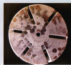
槽口尖角未倒角的触头老练试验前后