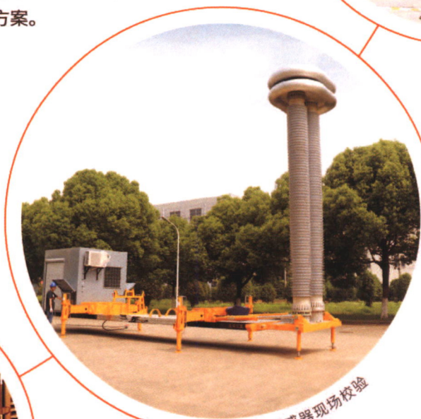
直流互感器现场校验