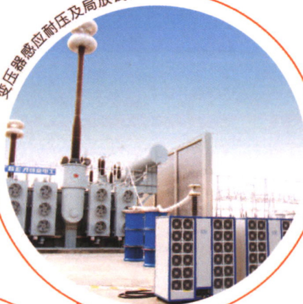
变压器感应耐压及局放试验

苏州工业园区海沃科技有限公司是一家专注于生产特种交直流试验电源及其衍生产品、致力于高压试验技术及服务的高新技术企业,为广大电力用户提供高压试验及检测的完备解决方案。